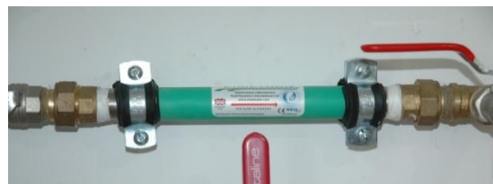
Prawidłowy sposób montażu urządzenia