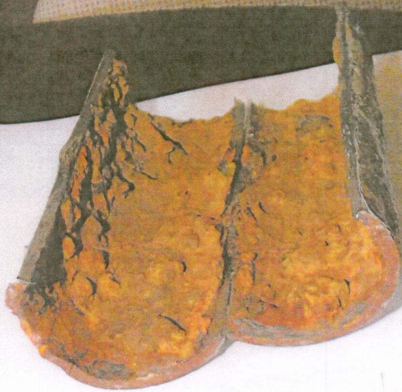
Zana 13 Pion wody zimnej (rura stal. oc. DN 40)